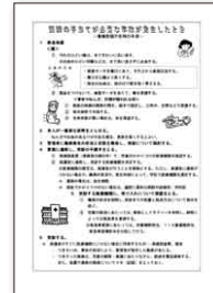
▲養護教諭不在時の対応

保健室から職員室への情報発信にも 養護教諭不在時の対応や、緊急連絡体制など、テンプレートをたたき台にして、各校の事情にあわせて作成していただけます。